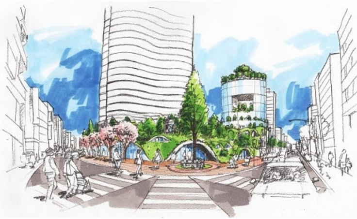
三鷹駅前の森イメージ