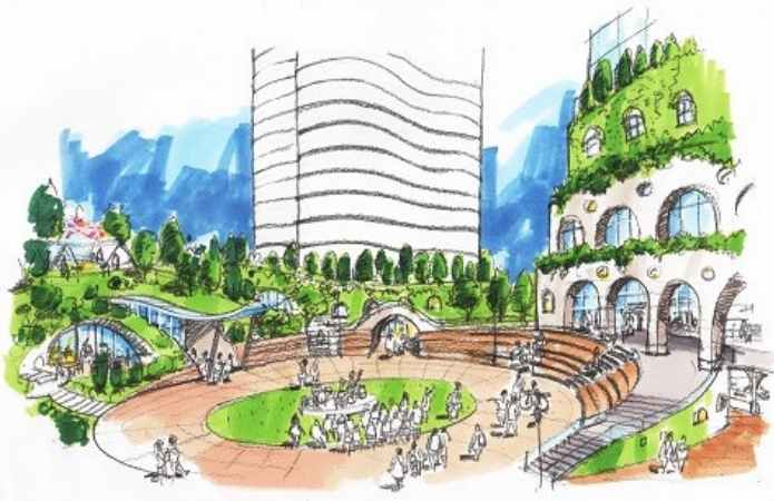
森と多機能広場のイメージ