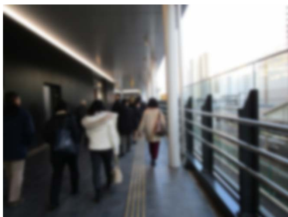
中央線を横に見ながら移動中です。↑