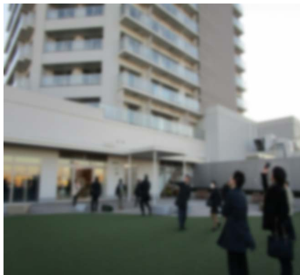
cocobunji WEST 5階は公益施設フロアで、外は屋上広場になっています。↑

また、南口の駅ビルも併せて見学しましたが、時代の変化に合わせて改装を行っていることに、賑わいを維持するための努力の大切さを感じました。