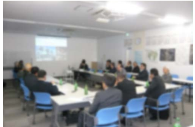
▲第82回勉強会（12/16）の様子