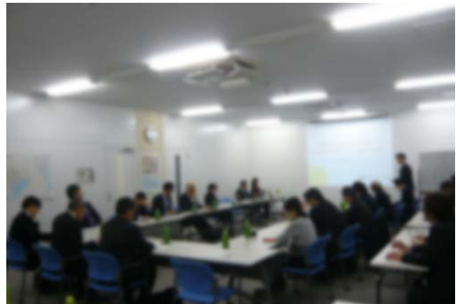
▲第83回勉強会（1/20）の様子