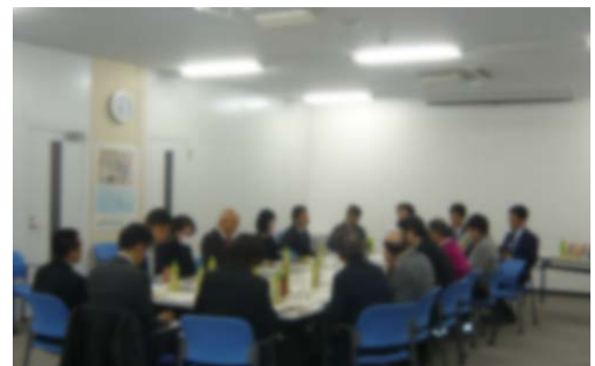
▲第85回勉強会（3/17）の様子