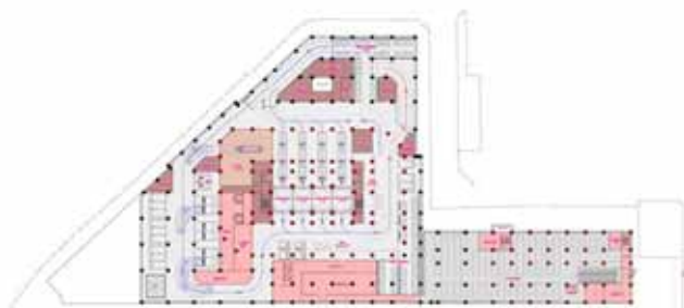
地下 1 階