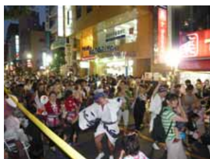
飛入り連のみなさま