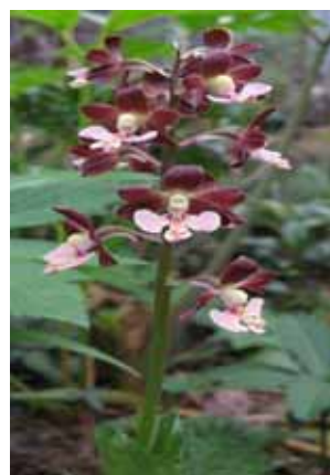
右 エビネ 花をつけたエビネ